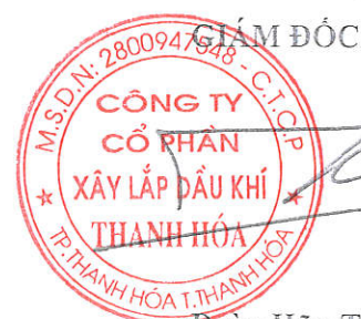
Đoàn Hữu Trắc